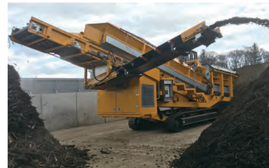
スタースクリーン