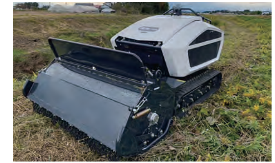
ハンマーナイフモア