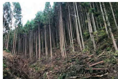
宮城県林業公社 平成30年度分収林 搬出間伐事業 24ha