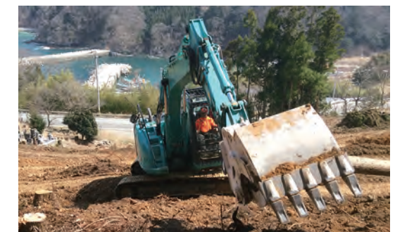
フェラーバンチャ