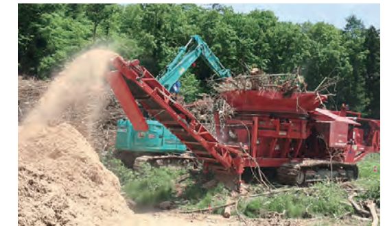
タブグラインダーS1000