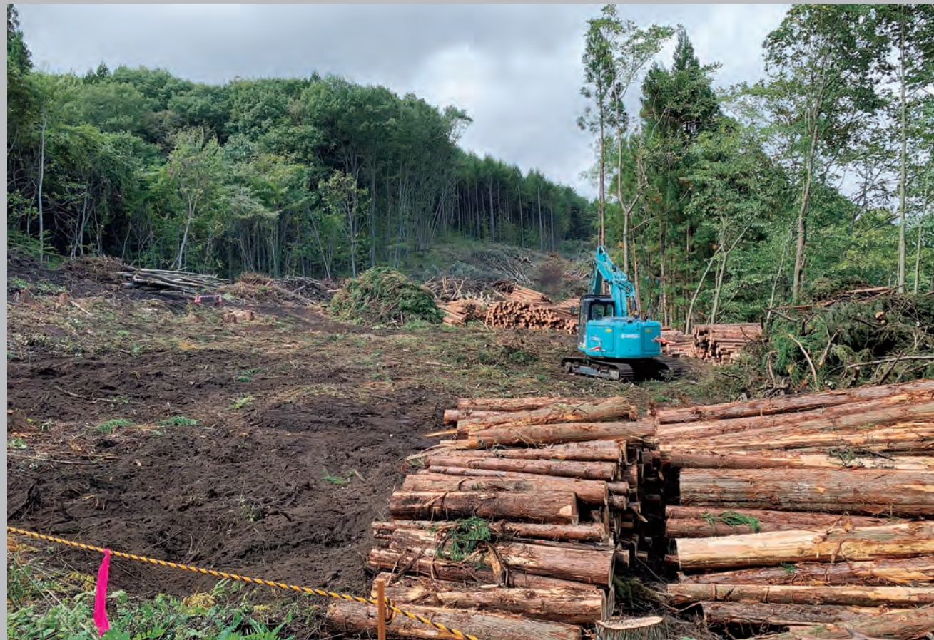
公共関与型産業廃棄物最終処分場土木施設建設工事 伐採