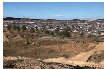
泉パークタウン 第6住区東工区開発計画造成工事