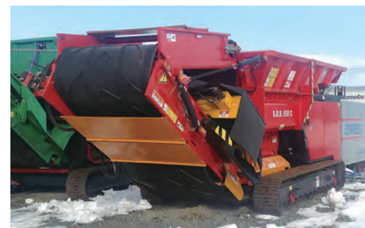
自走式大型二軸破砕機ビッグパスSRS650C