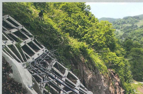
田麦俣地すべり七ツ滝ブロック 溪流保全工事 法面伐採工